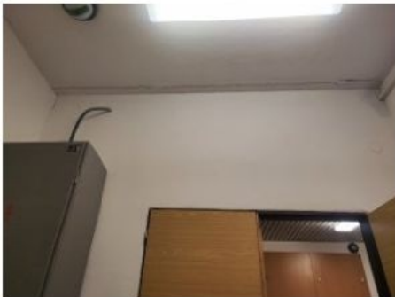
UX2NP-m234-f1.jpg 3.38 MB