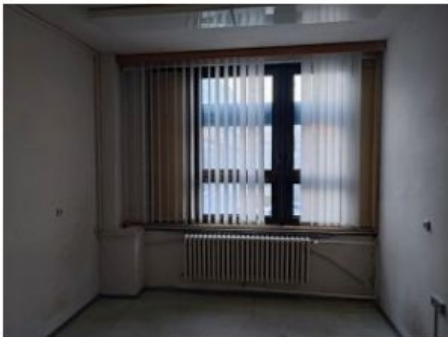
UX2NP-m232a-f1.jpg 3.41 MB