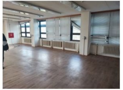
UX2NP-m234a-f4.jpg 4.01 MB