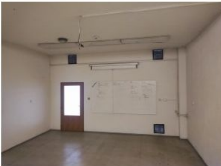
UX2NP-m234b-f1.jpg 3.80 MB