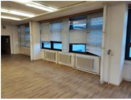
UX2NP-m234a-f2.jpg 4.20 MB