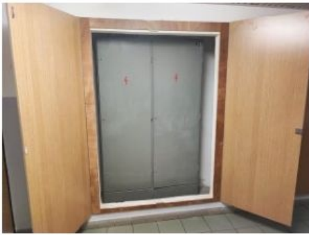
UX2NP-m221-f1.jpg 3.37 MB