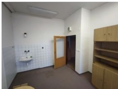
UX2NP-m238b-f1.jpg 1.87 MB