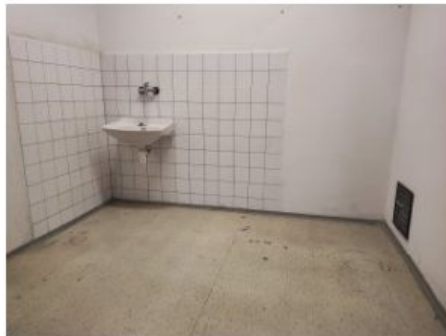
UX2NP-m234b-f2.jpg 3.55 MB