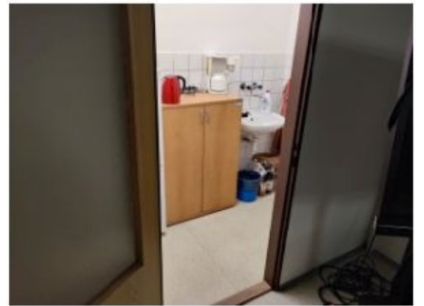
UX2NP-m229c-f1.jpg 3.09 MB