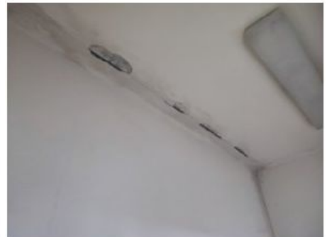
UX2NP-m236a-f2.jpg 2.60 MB