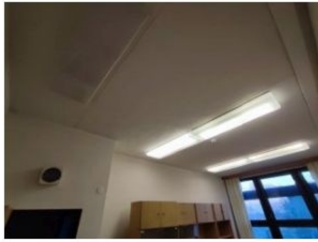
UX2NP-m238b-f4.jpg 2.15 MB