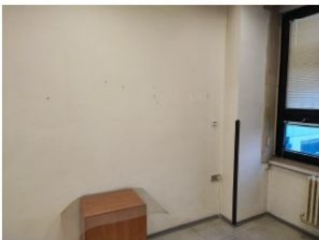
UX2NP-m233a-f1.jpg 3.80 MB