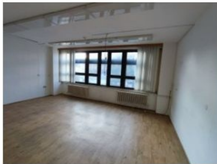
UX2NP-m225-f2.jpg 2.45 MB