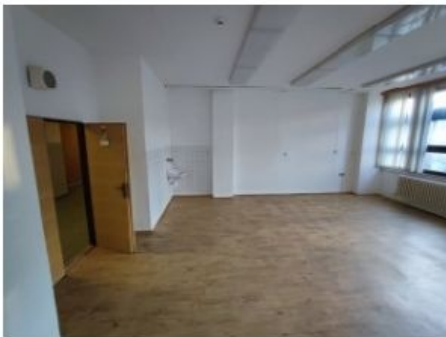
UX2NP-m225-f1.jpg 1.63 MB