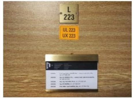
UX2NP-m223-f1.jpg 5.89 MB