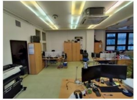
UX2NP-m229b-f1.jpg 2.25 MB