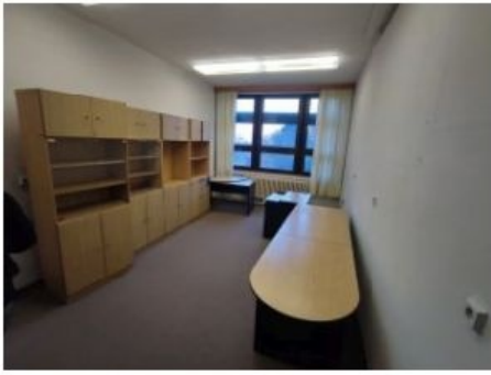
UX2NP-m238b-f3.jpg 1.80 MB