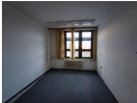
UX2NP-m232b-f1.jpg 2.08 MB