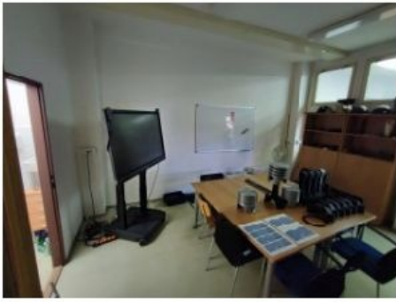
UX2NP-m229a-f1.jpg 1.83 MB