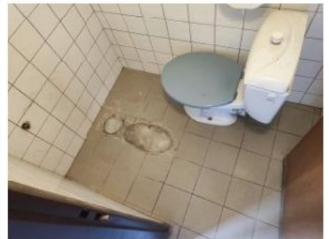
UX2NP-m228a-f1.jpg 3.22 MB