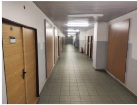
UX2NP-m221-f2.jpg 4.13 MB