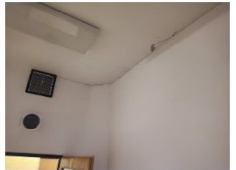
UX2NP-m234b-f3.jpg 3.19 MB