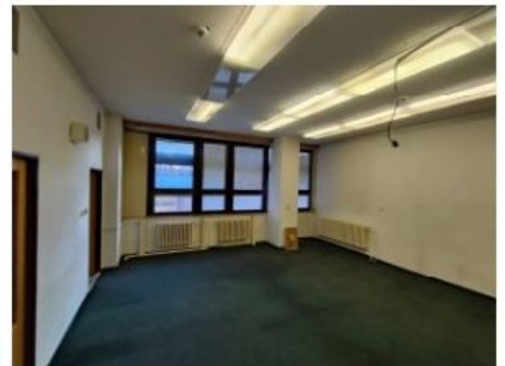
UX2NP-m227a-f1.jpg 2.23 MB