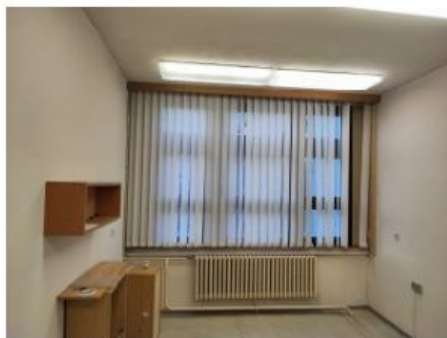
UX2NP-m233b-f1.jpg 3.41 MB