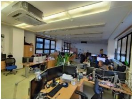
UX2NP-m229b-f2.jpg 2.52 MB