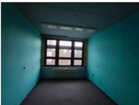
UX2NP-m238a-f1.jpg 2.17 MB