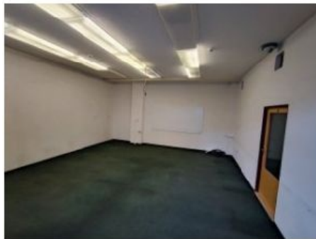
UX2NP-m227a-f3.jpg 1.85 MB