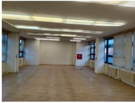
UX2NP-m234a-f3.jpg 3.23 MB