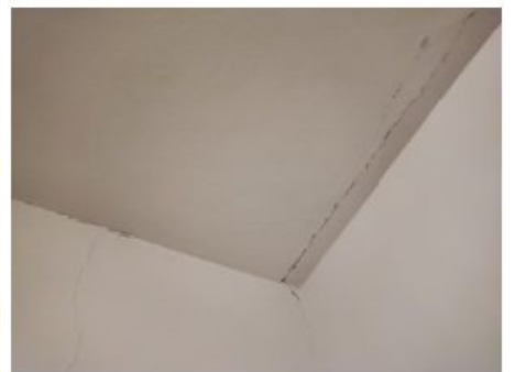
UX2NP-m238b-f2.jpg 2.85 MB