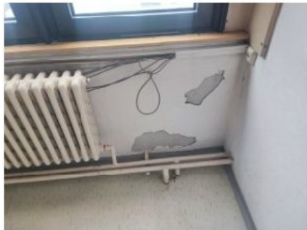
UX2NP-m236a-f1.jpg 3.82 MB