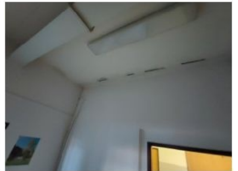
UX2NP-m232-f1.jpg 1.82 MB