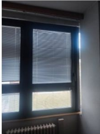
UX2NP-m229b-f3.jpg 4.23 MB