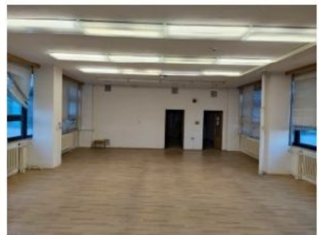
UX2NP-m234a-f1.jpg 3.07 MB