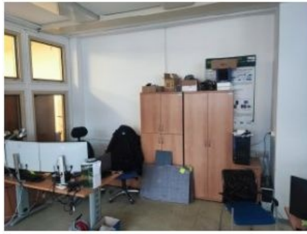
UX2NP-m229a-f2.jpg 3.37 MB